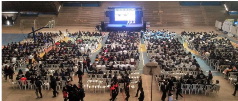
Asistencia masiva de estudiantes