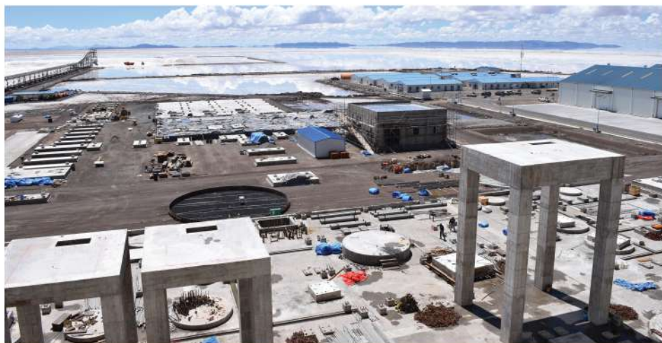
Planta Industrial de Carbonato de Litio (En construcción)