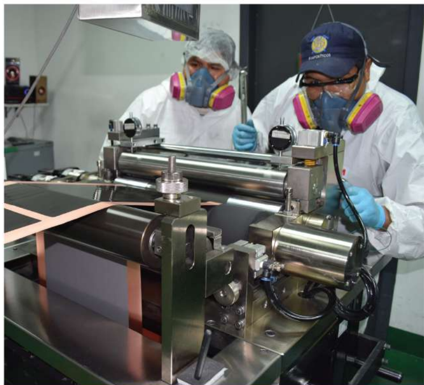
Técnicos YLB en la Planta Piloto de Materiales Catódicos y Baterías (La Palca - Potosí)

La expedición concluyó en la Planta Piloto de Materiales Catódicos en el Complejo Industrial de La Palca – Potosí, donde realizó una similar acción.