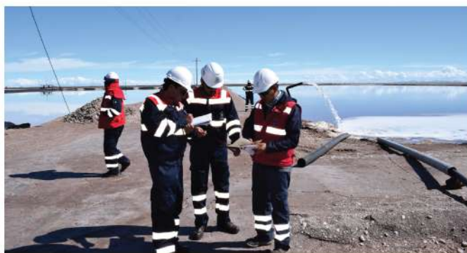
Inspección de Gerente Ejecutivo YLB (Piscinas industriales)

En la inducción acompañaron, además de técnicos de la unidad administrativa y de Comunicaciones, el Director de Operaciones, quien condujo la inspección por las distintas instalaciones de la Planta transfiriendo información de los avances, dificultades y de las actividades para la gestión 2020.